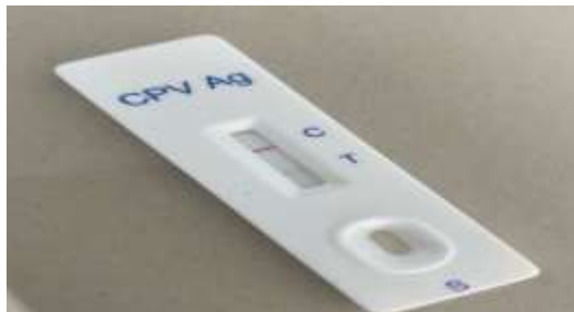
Gambar 2. Hasil tes kit CPV Ag

Hasil anamnesa, pemeriksaan fisik, serta pemeriksaan penunjang dengan tes kit CPV Ag dan pemeriksaan darah terlihat pada gambar 1 dan gambar 2