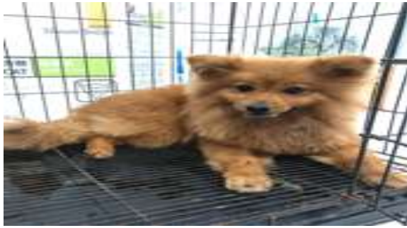
Gambar 1. Anjing Boston.