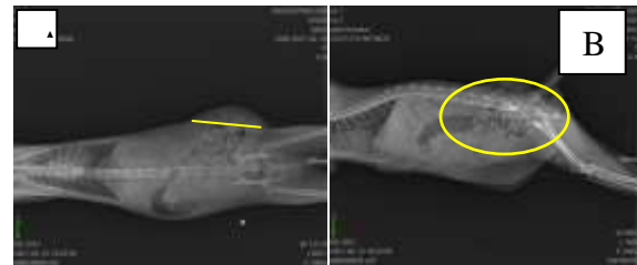
Gambar 1. Hasil pemeriksaan X-Ray pada kucing mimi. A. Posisi ventrodorsal, garis kuning menunjukkan diameter cincin hernia. B Posisi lateral menunjukkan adanya sebagian usus besar, dan usus halus yang menonjol keluar dari batas dinding abdomen.

Hasil pemeriksaan X-ray (gambar 1) dengan posisi ventrodorsal dan lateral, terlihat bagian persembulan organ yaitu usus halus, usus besar dan lemak. Hal ini dapat dikonfirmasi saat pelaksanaan operasi. Batas diameter cincin hernia pun dapat dilihat pada adanya garis kuning yang merupakan diameter yang cukup besar untuk kejadian hernia dinding abdomen.