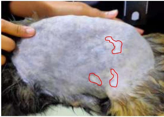
Gambar 4. Permukaan kulit area hernia terdapat bekas luka (garis merah).

Pada kasus ini, posisi hernia berada di lateral abdomen. Trauma itu cukup kuat untuk merobek otot di bagian abdomen. Organ pencernaan seperti usus halus melewati luka trauma tersebut dan terperangkap di antara otot dan bagian bawah kulit. Kasus seperti ini perlu ditangani karena dapat mengganggu suplai darah ke organ usus yang keluar dari rongga abdomen tersebut. Suplai darah yang kurang dapat menyebabkan kematian jaringan pada usus dan selanjutnya dapat menyebabkan kematian pada hewan (Rizk and Samy, 2016). Oleh karena itu penanganan yang paling tepat adalah dengan melakukan tindakan operasi.